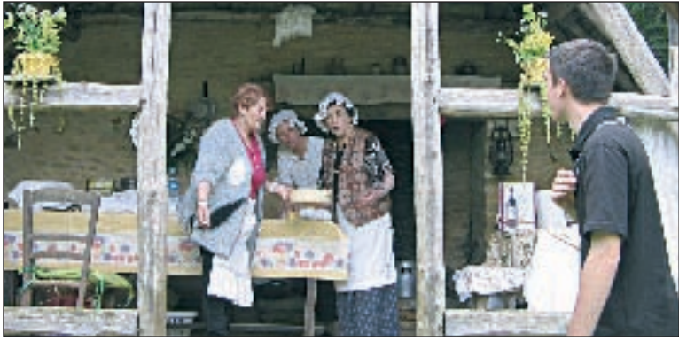
Les cuisinières s'affairent au cantou