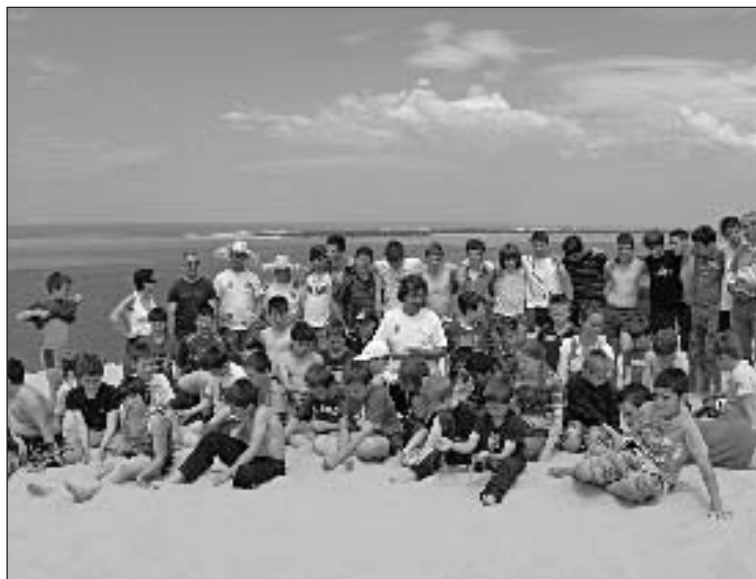
Au sommet de la plus haute dune d'Europe

Les jeunes de l'école de rugby de l'Espérance sportive montignacoise ont clôturé leur saison de manière fort agréable par des rencontres, les 7 et 8 juin, avec leurs homologues du club de rugby d'Arcachon, et l'ascension des 103 mètres de la dune du Pilat. Ils se sont retrouvés ainsi une bonne cinquantaine, âgés de 7 à 15 ans, au bord du bassin, encadrés par leurs éducateurs, des bénévoles du club et des parents accompagnateurs.