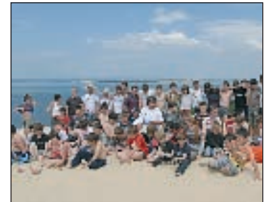
Les jeunes de l'école de rugby de l'Espérance sportive montignacoise ont clôturé la saison sur le bassin d'Arcachon