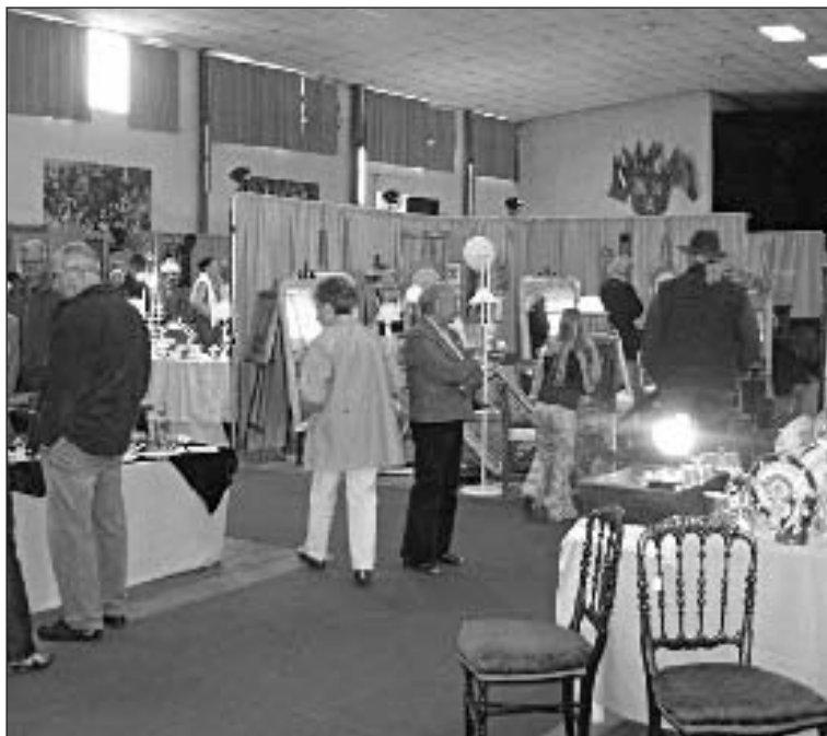
De bien jolies choses !