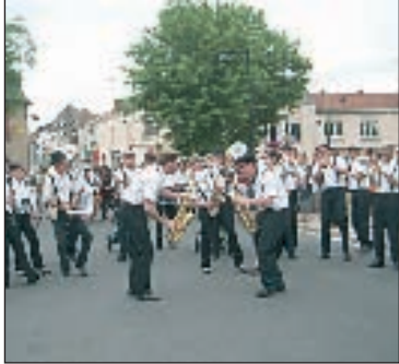
L'orchestre de rue aux grands prix nationaux de May-sur-Evre