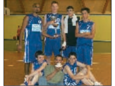
Au tournoi du Capo, les cadets remportent le trophée du fair-play et celui du meilleur coach