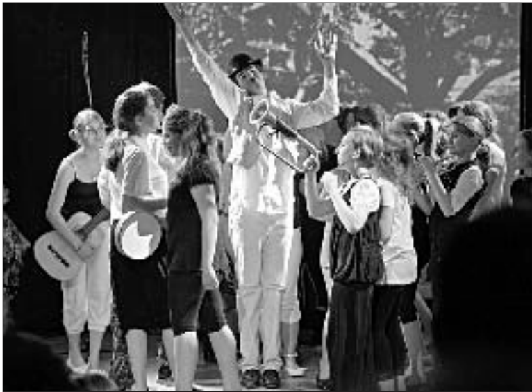
L'un des meilleurs moments de " Jazz à l'âme "