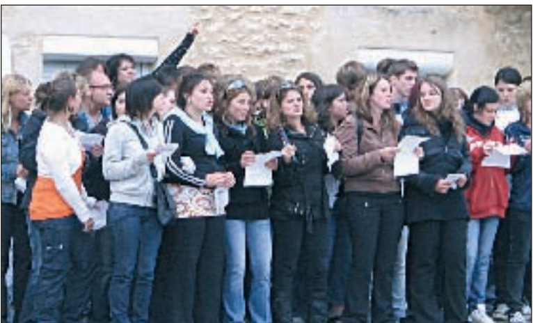
Chantons en chœur " la Balade des gens heureux "