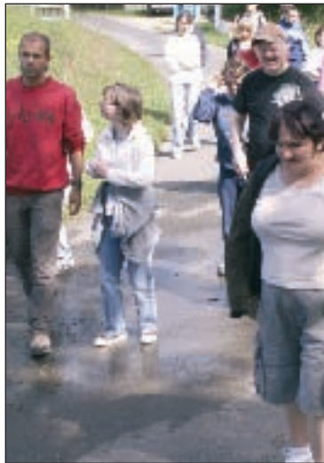
Randonnée dans la Bessède pour les pensionnaires du Bercaill de la Barde