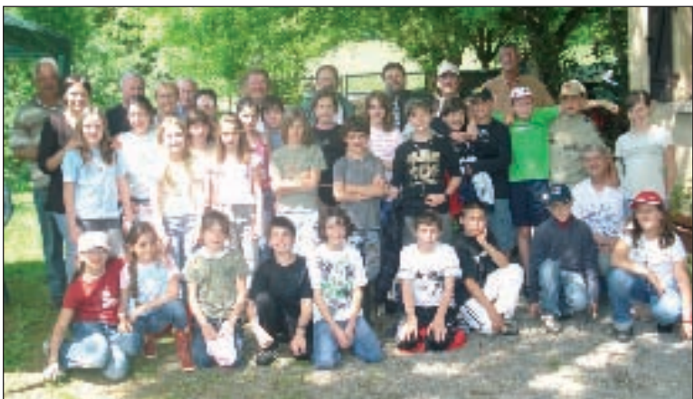
Les enfants du CM1 et du CM2 avec leur instituteur et des membres de la Société de pêche

Comme chaque année, la Société de pêche organise des journées au Riol pour les écoliers.