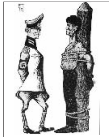
Speidel : Si cela peut vous consoler sachez que j'aurai votre fils sous mes ordres