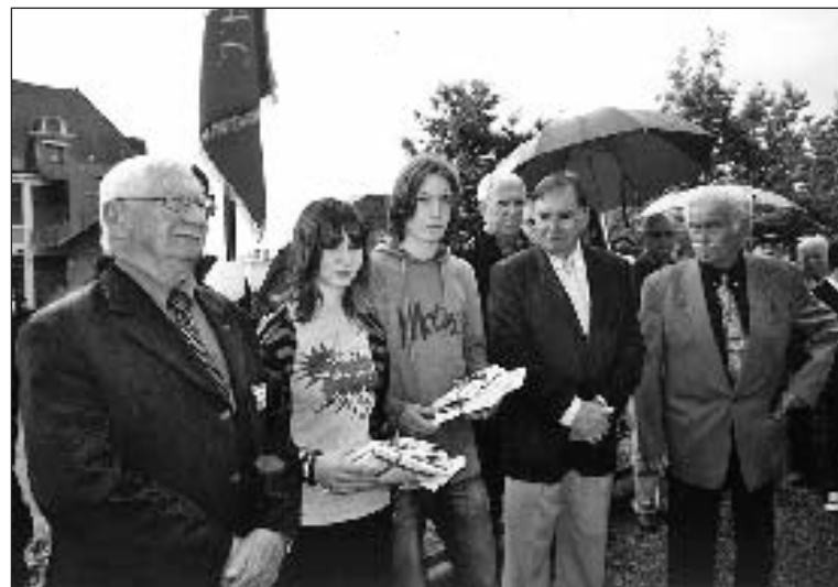
Des lauréats dignement honorés