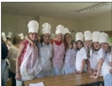
Le troisième trimestre à l'école anglaise Downe House School