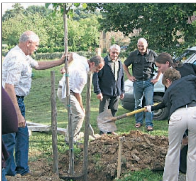
Tous les membres ont mis la main à la bêche