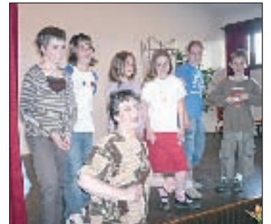
Fin d'année à l'école occitane