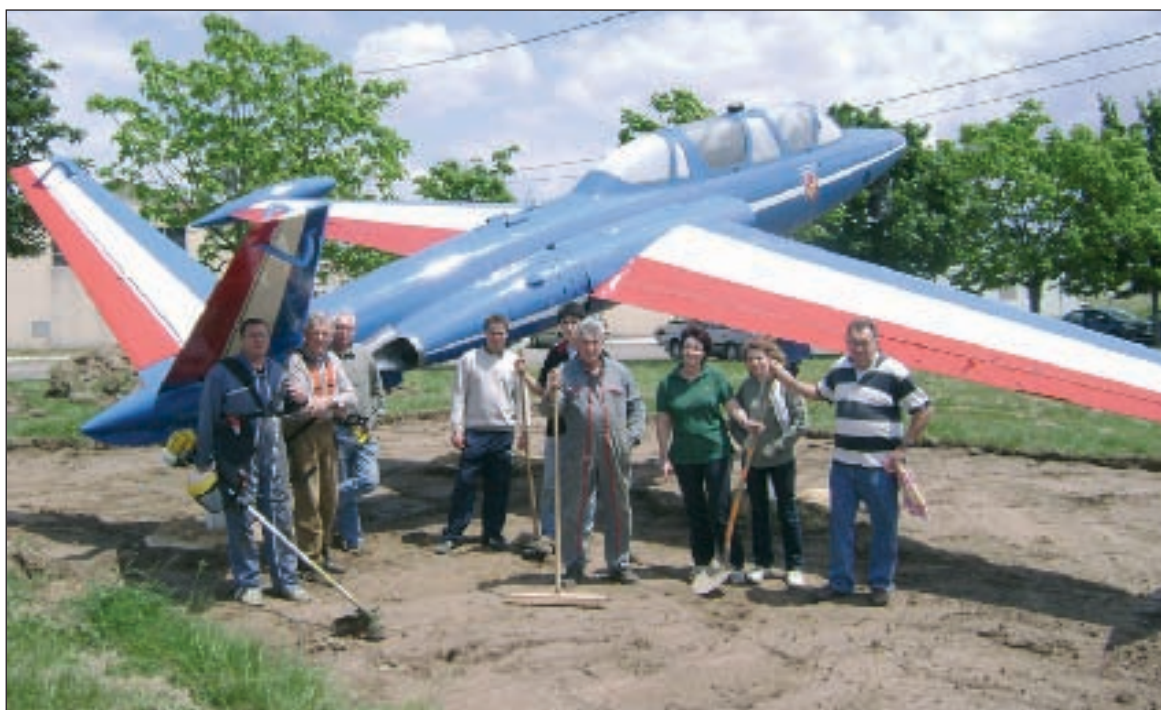
Ils ont échangé le manche à balai contre le manche de pioche... et achèvent la mise en place du Fouga Magister Patrouille de France

L'équipe paraît déjà solide, déterminée et souriante, mais ils étaient plus du double, occupés aux quatre coins du terrain, échappant ainsi à l'œil du photographe.