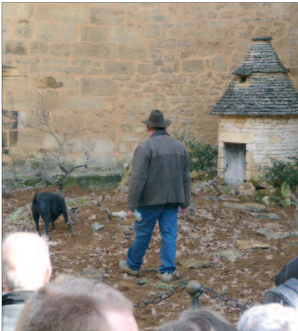
Démonstration de cavage au pied de la cathédrale de Sarlat lors de la Fête de la truffe en 2009

La ville de Sarlat, les Foies gras Rougié et la Maison Pébeyre donnent naissance à la première Académie culinaire de la truffe et du foie gras. Cette institution s'illustrera pour la première fois les 16 et 17 janvier lors de la Fête de la truffe à Sarlat. Un concours verra s'affronter huit jeunes cuisiniers qui auront deux plats à préparer, une tourte au foie gras d'oie et truffes et un foie gras de canard chaud et truffes.