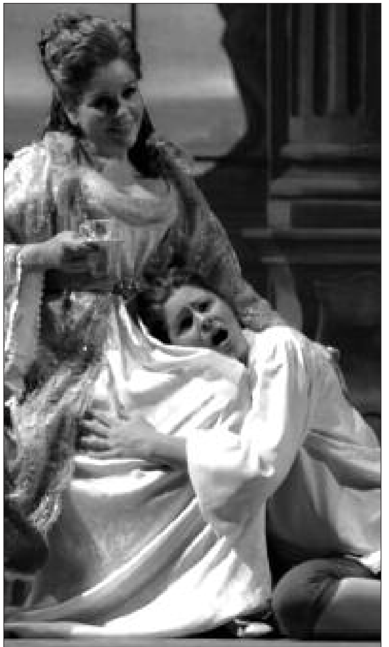
Renée Fleming et Susan Graham