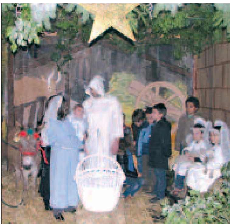
Noël festif, joyeux et recueilli en l'église de Nadaillac avec la traditionnelle crèche vivante et des paroissiens venus nombreux assister à la veillée de Noël et fêter la venue du divin enfant.