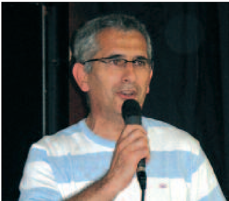
Lors de la plantation du mai en 2008