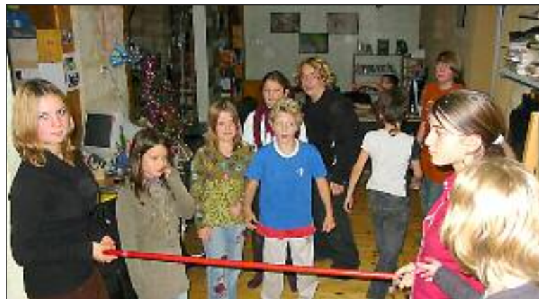
Les enfants lors de la soirée du 7 octobre