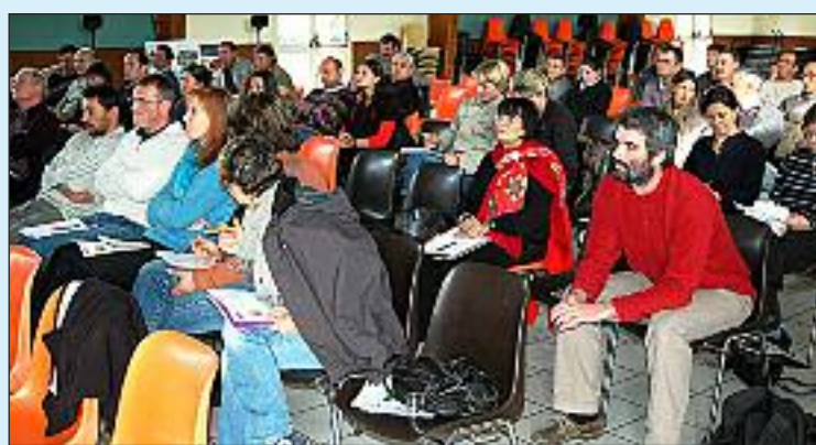
L'assistance était composée d'élus, d'agriculteurs et de conseillers

Ces dernières semaines, les premiers résultats du recensement général agricole sont tombés. Il y