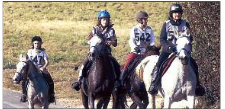
Lors de l'endurance de Beaumont-du-Périgord

Dimanche 16 octobre, six cavaliers du club participaient à une épreuve d'endurance à Dégagnac, dans le Lot.