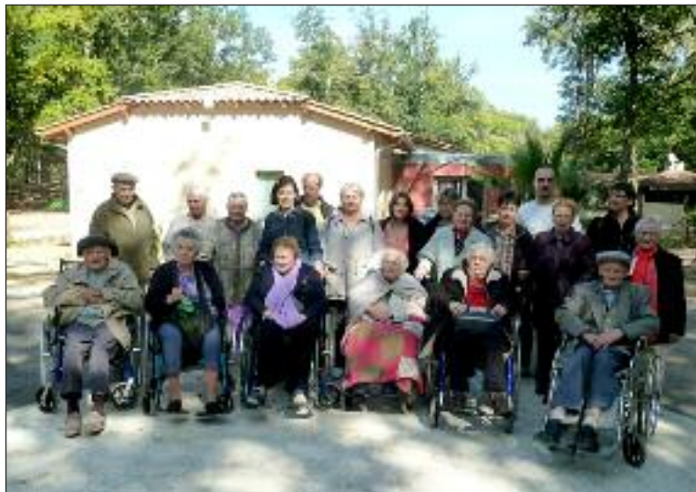
Aînés et personnel